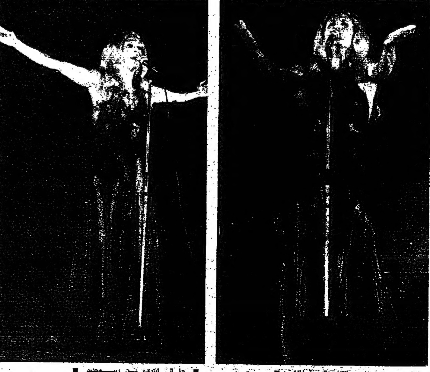
الابنية الصونية الاخرة